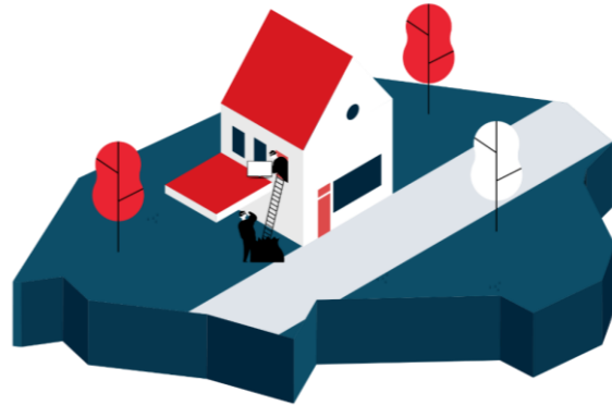
Veel voorkomende criminaliteit/ High Impact Crimes